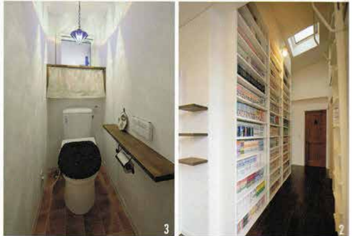
1. ロフトは2室に仕切り、1室はご主人の隠れ家的スペースとして、1室は家族用の空間として使用。窓が付いているので、普通の部屋のような使い方も十分可能だ 2. 2階の廊下にも大容量の本棚を設置 3. カフェにあるようなナチュラルな雰囲気トイレ