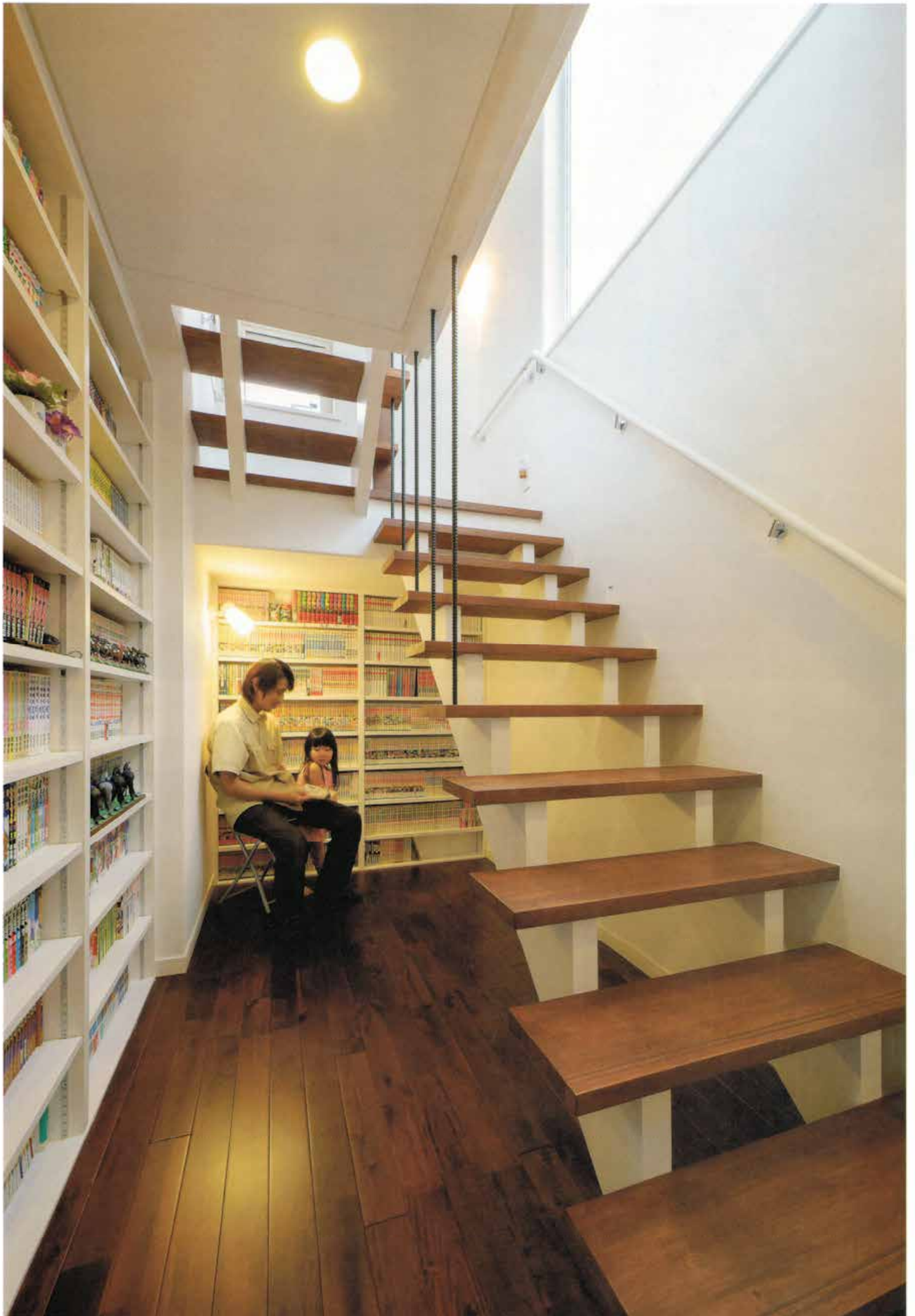
階段下を上手に利用し、ご主人愛蔵の本を収納する本棚を確保。ちょっとした読書コーナーとしても利用している。